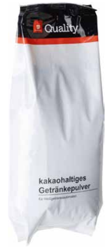
QUALITY – KAKAO MIX 16% für Automaten