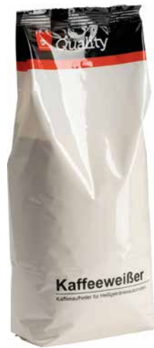
QUALITY – KAFFEEWEISSER kräftig für Automaten