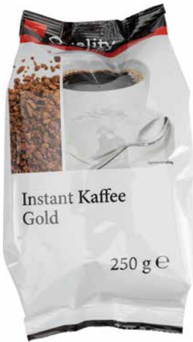
QUALITY – INSTANTKAFFEE kräftig für Automaten

Instantprodukte erfreuen sich auf dem Heißgetränkemarkt einer großen Popularität, und auch die Vorteile eines löslichen Getränks werden in einer schnelllebigen Zeit immer bedeutender. Beim hohen Stellenwert der österreichischen Kaffeekultur zählt natürlich auch bei Instantprodukten ein hervorragendes Aroma.